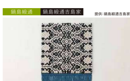
鍋島織通 鍋島織通吉島家 提供:鍋島織通吉島家 手織花掛結文鉄紺地50 管理番号:P0318 寄付額 500,000円 サイズ:W500×L500mm、毛足20mm 素材:木綿 発送期日:入金確認後3~4ヶ月程度