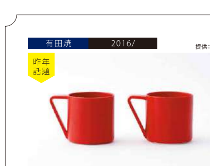
有田焼 2016/ 提供:2016 昨年話題 Mug Red 2客 管理番号:P3402 寄付額 30,000円 サイズ:各H78×W107×D78mm (270ml) 素材:磁器 発送期日:入金確認後2週間程度。ただし、在庫がない場合は1ヶ月程度