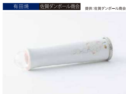
有田焼 佐賀ダンボール商会