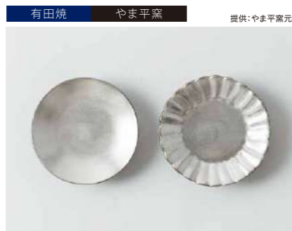
有田焼 やま平窯 提供:やま平窯元