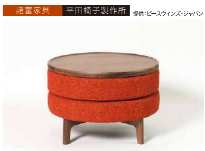
PISOLINO Circle Stool&Tray