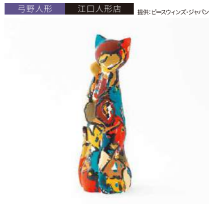
弓野人形 江口人形店 提供:ピースウィンズ・ジャパン 猫の誘いBRAIN (Multi) 管理番号:P1008 寄付額 150,000円 サイズ:H220×φ73mm 素材:粘土 発送期日:入金確認後2週間程度