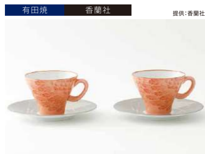
有田焼 香蘭社