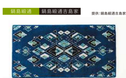
鍋島織通 鍋島織通吉島家 提供:鍋島織通吉島家 新鍋島玲瓏金枝幾何学文中藍地 管理番号:P0317 寄付額 1,500,000円 サイズ:W600×L1200mm、毛足12mm 素材:木綿 発送期日:入金確認後3~4ヶ月程度