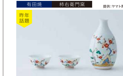
有田焼 柿右衛門窯 提供:ヤマト陶磁器 昨年話題 松竹梅文半酒器 管理番号:P3304 寄付額 250,000円 サイズ:錦牡丹鳥文德利H120×φ77mm、猪口各H31×φ61mm 素材:磁器 発送期日:入金確認後2週間程度。ただし、在庫がない場合は6ヶ月程度