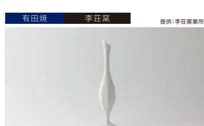
有田焼 李荘窯 提供:李荘窯業所 八面取り細花入れ白マット 管理番号:P1513 寄付額 100,000円 サイズ:H295×φ75mm 素材:磁器 発送期日:入金確認後2週間程度。ただし、在庫がない場合は2ヶ月程度