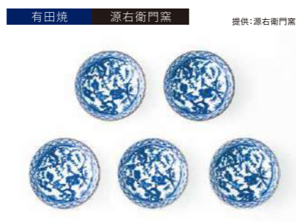
有田焼 源右衛門窯 提供:源右衛門窯

サイズ:L156×φ37mm 素 材:磁器・水晶玉・ミラー 発送期日:入金確認後2週間程度。ただし、在庫がない場合は1カ月程度