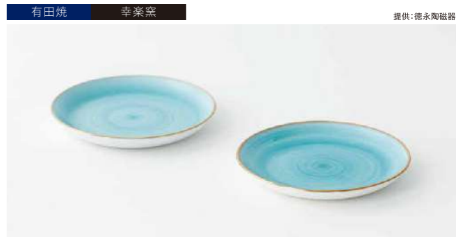
有田焼 幸楽窯 提供:徳永陶磁器 豆皿翡翠2枚 管理番号:P2708 寄付額 10,000円 サイズ:各H12×φ90mm 素材:磁器 発送期日:入金確認後2週間程度。ただし、在庫がない場合は1ヶ月程度