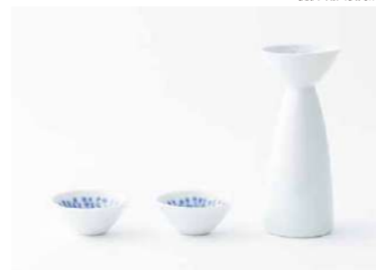
副久GOSU hana 1.0-5.0 酒器セット