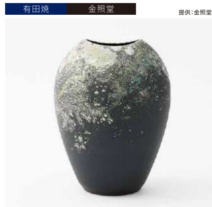
有田焼 金照堂 提供:金照堂 麟Lin finesse HEART 管理番号:P2462 寄付額 300,000円 サイズ:H200×φ150mm 素材:磁器 発送期日:入金確認後2週間程度。ただし、在庫がない場合は2ヶ月程度