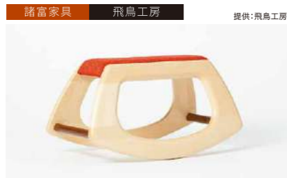
諸富家具 飛鳥工房 提供:飛鳥工房 モクバ 管理番号:P0508 寄付額 600,000円 サイズ:H377×W715×D320mm 素材:木(ビーチ)・ポリエステル 発送期日:入金確認後3週間程度。ただし、在庫がない場合は1ヶ月程度