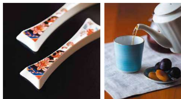
テキスト：澄川伸一

幸楽窯は、1865(慶応元)年から現在まで続く有田焼の歴史ある窯元です。現在は、小学校の建物をそのまま使った工房がともユニークで、そのスケール感も驚くほど大きい。国内外の観光客に人気で、さまざまな見学コースや体験コースがあります。中でも人気なのは「トレジャーハンティング」と呼ばれる時間制限内の焼物の宝探し。おすすめです。