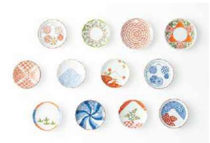
富士山四十八景豆皿 12枚