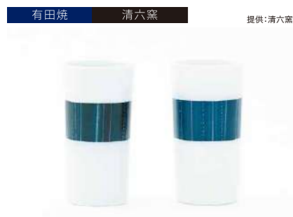
有田焼 清六窯

サイズ:碗各H63×φ85mm(100ml)、皿各H15×φ145mm 素 材:磁器 発送期日:入金確認後3週間程度