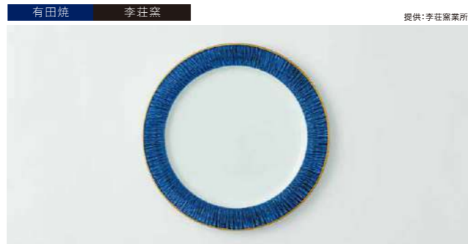
有田焼 李荘窯 提供:李荘窯業所 飛び鉋ディナープレート青藍地縁金 管理番号:P1514 寄付額 20,000円 サイズ:H15×φ240mm 素材:磁器 発送期日:入金確認後2週間程度。ただし、在庫がない場合は2ヶ月程度