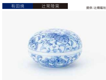
有田焼 辻常陸窯

サイズ:各H35×φ140mm 素 材:磁器 発送期日:入金確認後2週間程度。ただし、在庫がない場合は2カ月程度