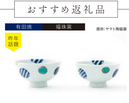
有田焼 福珠窯 提供:ヤマト陶磁器 昨年話題 染錦地紋丸紋対飯碗 管理番号:P3350 寄付額 25,000円 サイズ:H60×φ112mm、H55×φ107mm 素材:磁器 発送期日:入金確認後2週間程度。ただし、在庫がない場合は1ヶ月程度