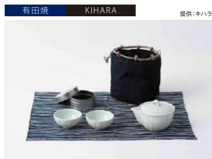
有田焼 KIHARA 提供:キハラ

サイズ:イタリアピューター小皿H20×φ105mm イタリアピューター菊割小皿H23×φ108mm 素 材:磁器 発送期日:入金確認後2カ月程度