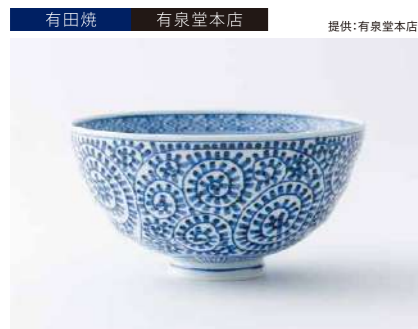
有田焼 有泉堂本店