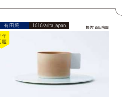
有田焼 1616/arita japan 提供:百田陶園 昨年話題 Coffee Cup/Saucer (Light Brown) 管理番号:P3203 寄付額 20,000円 サイズ:コーヒーカップH53×φ72mm、ソーサーH3×φ170mm 素材:磁器 発送期日:入金確認後3週間程度。ただし、在庫がない場合は1ヶ月程度