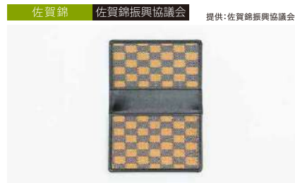
佐賀錦 佐賀錦振興協議会 提供:佐賀錦振興協議会 蝶花 佐賀錦 <カードケース> 管理番号:P0112 寄付額 150,000円 サイズ:W110×L75mm 素材:絹・和紙・金箔・牛革 発送期日:入金確認後3週間程度。ただし、在庫がない場合は6ヶ月程度