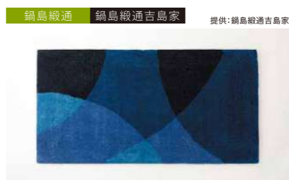
鍋島織通 鍋島織通吉島家 提供:鍋島織通吉島家 新鍋島重ね円水文花浅葱地 管理番号:P0316 寄付額 1,400,000円 サイズ:W600×L1200mm、毛足12mm 素材:木綿 発送期日:入金確認後3~4ヶ月程度