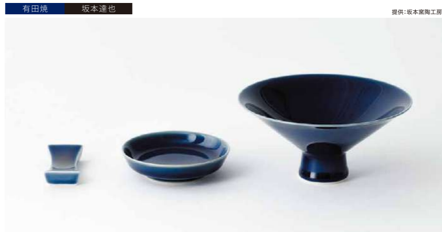
有田焼 坂本達也 提供:坂本窯工房 瑠璃茶碗と瑠璃箸置きと瑠璃豆皿 管理番号:P2333 寄付額 35,000円 サイズ:瑠璃茶碗H62×φ140mm(高台H22mm)、 瑠璃箸置きH12×W66×D30mm、瑠璃豆皿H20×φ85mm 素材:磁器 発送期日:入金確認後2週間程度。ただし、在庫がない場合は2ヶ月程度