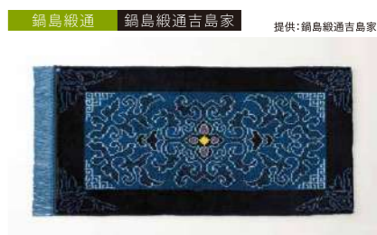
鍋島織通 鍋島織通吉島家 手織花菱龍唐草縁欧華文花浅葱地山吹中心 管理番号:P0315 寄付額 2,400,000円 サイズ:W600×L1200mm、毛足20mm 素材:木綿 発送期日:入金確認後3~4ヶ月程度