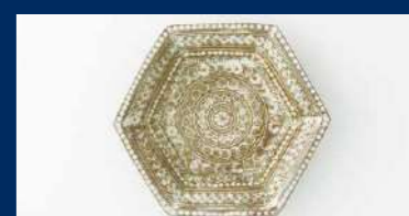
関古窯〈硝子釉三鳥手六角鉢〉