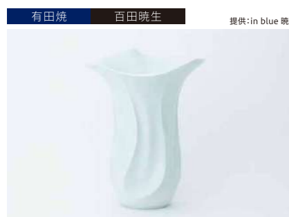
有田焼 百田暁生