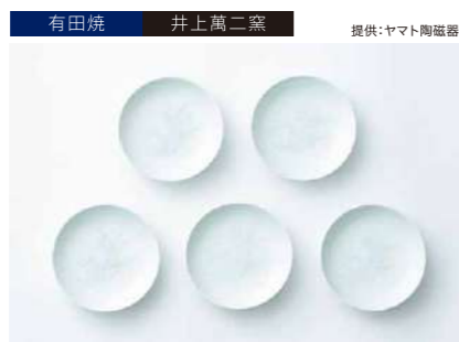
有田焼 井上萬二窯

サイズ:宝品急須H70×φ100mm、湯呑H35×φ75mm、 茶缶H38×φ73mm、茶巾1枚、巾着袋1枚 素 材:磁器・ブリキ・麻・綿・ポリエステル 発送期日:入金確認後1週間程度。ただし、在庫がない場合は1カ月程度