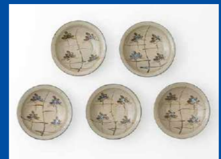
中里太郎右衛門窯〈絵唐津銘々皿 5客組〉