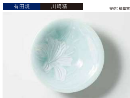
有田焼 川崎精一