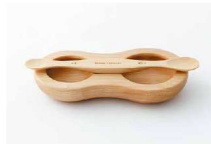
ファーストスプーンと器のセット