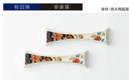
有田焼 幸楽窯 提供:徳永陶磁器 カトラリーレストリアリタ 2個 管理番号:P2716 寄付額 25,000円 サイズ:各H10×W145mm 素材:磁器 発送期日:入金確認後2週間程度。ただし、在庫がない場合は1ヶ月程度