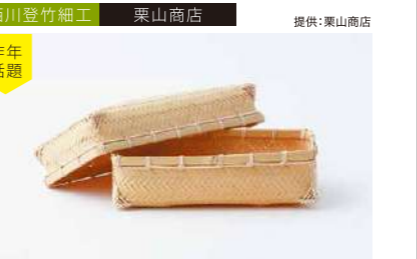
西川登竹細工 栗山商店 提供:栗山商店 昨年話題 網代弁当箱 管理番号:P0801 寄付額 50,000円 サイズ:H75×W200×D120mm 素材:竹 発送期日:入金確認後2ヶ月程度